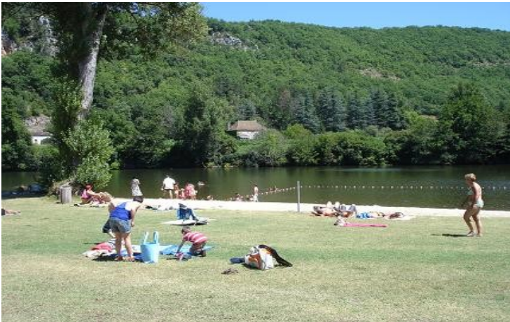
Strand Saint Cirq Lapopie

Eenvoudig te bereiken en te vinden op ongeveer 10 minuten van Maison Riante: een heus strand (zand en gras) met (bewaakt) zwemmen in de rivier nabij Saint Cirq Lapopie. Een terras en snackbar is aanwezig.