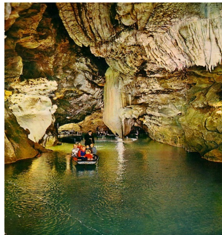
Gouffre de Padirac

Verder zijn in de omgeving o.a. te bezoeken: Les phosphatières du Cloup d'Aural (oude fosfaatmijnen), La Grotte de Foissac (prehistorische grot met ondergrondse rivier) en La Grotte de Roland (prehistorische grot).